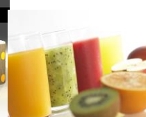
「ワンダーフルーツ」店舗（左）、 商品（右）イメージ