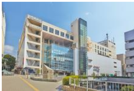
新百合ヶ丘エルミロード外観

小田急線新百合ヶ丘駅前に位置する地上7階・地下1階建ての商業施設です。核店舗のイトーヨーカドーやOdakyu OXのほか、ファッションや生活雑貨、カフェ&レストランなどの約90店の専門店が構成されています。