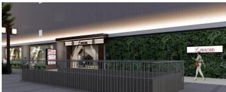
正面入口（左）、駅側入口（右）イメージ