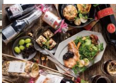
「ザ・グロッサリー&ワイン by サンクゼール」 店舗（左）、商品（右）イメージ